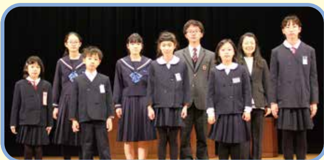
図画・ポスターの受賞者