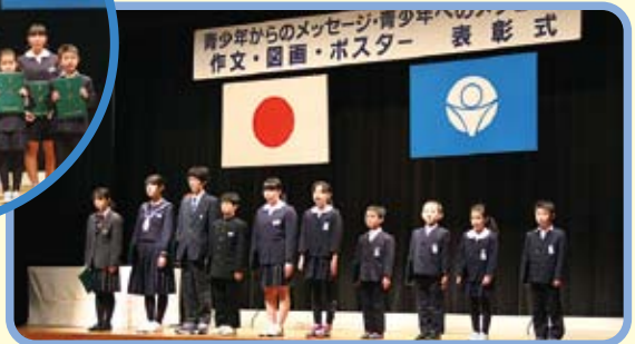
▲図画・ポスターの表彰