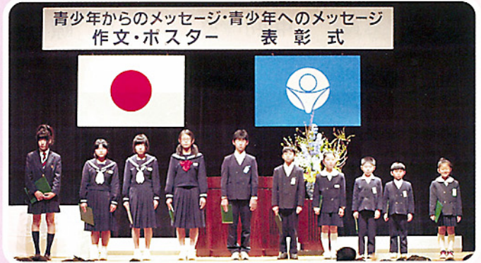
青少年からのメッセージ・青少年へのメッセージ 作文・ポスター 表彰式