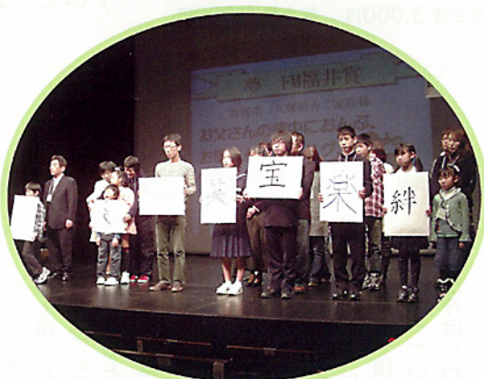
受賞者全員が家族から連想する漢字を一字書いて、先生からの説明を聞きました。

先生は、皆さんの名前もご両親がいろいろ考えて付けて下さった尊い名前ですから、感謝して大切にしてください。時間があったら、自分の名前(漢字)の成り立ちと由来を探ってみるのも楽しいですよ!と話して下さいました。