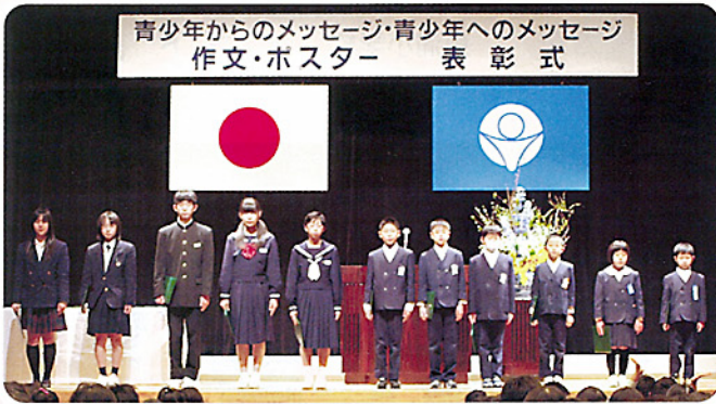
青少年からのメッセージ・青少年へのメッセージ 作文・ポスター 表彰式

なんと、市内小・中・高校生 の7割近くの皆さんからメッセージ をいただきありがとうございました。 町中が青少年や大人のメッセージを わかりあえるなんて、素敵なお出 いではありませんか。